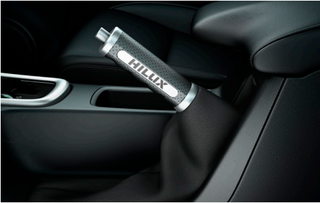
Шкіряний чохол ручки ручного гальма