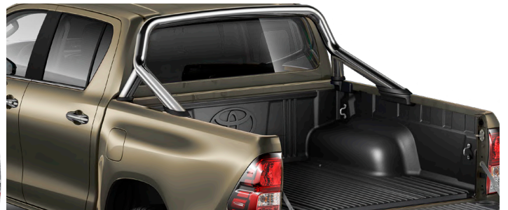
Дуга вантажної платформи