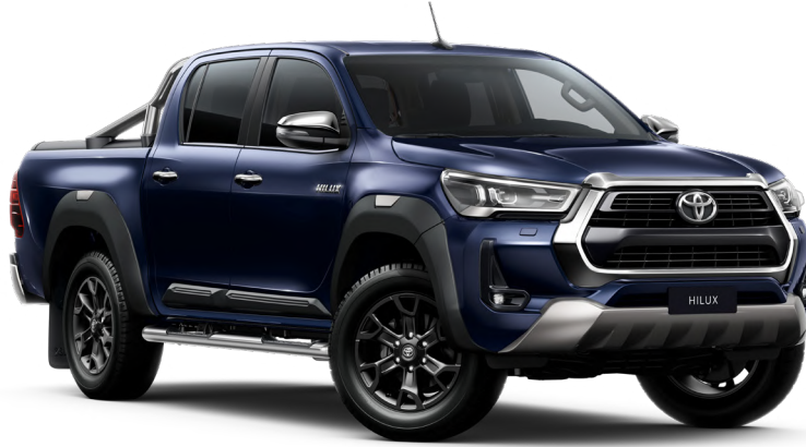
Декоративна накладка переднього бампера, сірого кольору