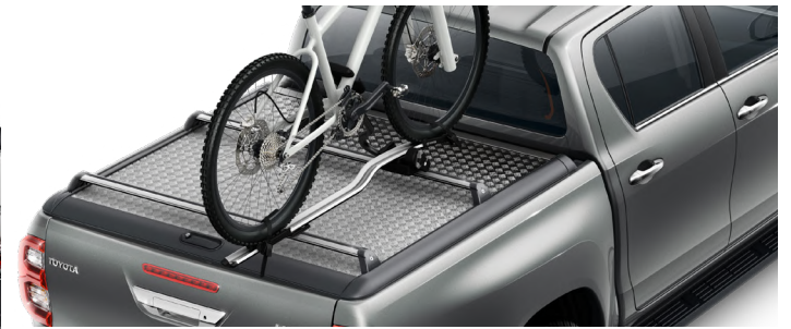
Кріплення для перевезення велосипеда на даху