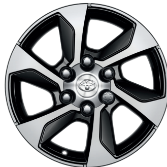
Колісні диски R18