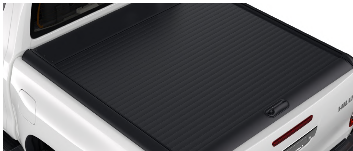
Кришка вантажної платформи