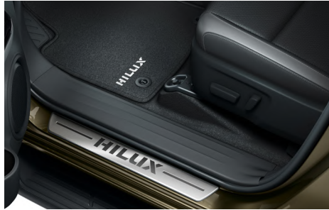
Накладки дверних порогів, килимки гумові