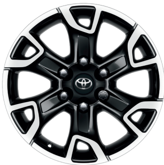
Колісні диски R17