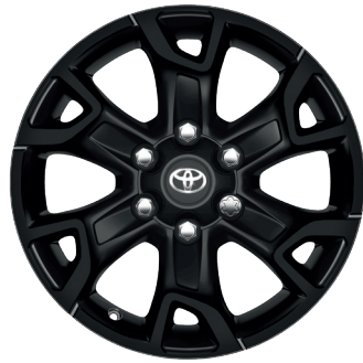
Колісні диски R17