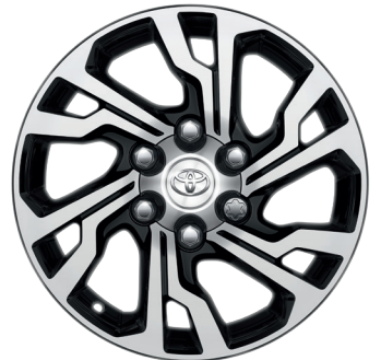
Колісні диски R18