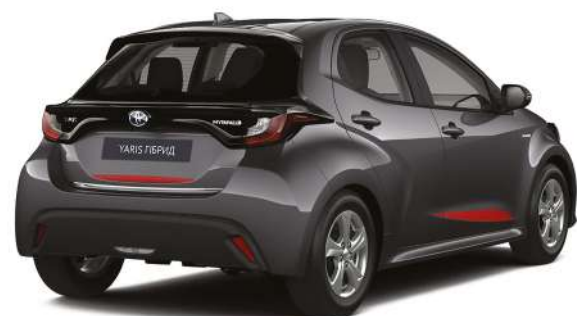
Комплект декоративних наклеек переднього бампера та бокових дверей та кришки багажника, червоного кольору