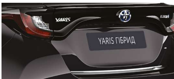
Декоративна накладка дверей багажного відділення, хром