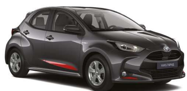
Комплект декоративних наклеек переднього бампера та бокових дверей та кришки багажника, червоного кольору