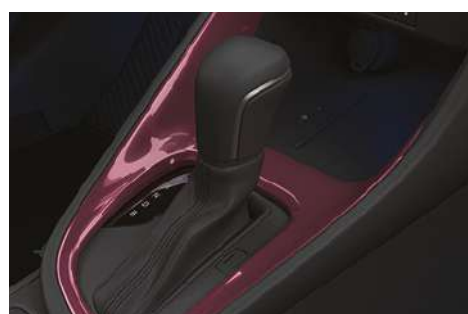
Накладка центральної консолі, пурпурна