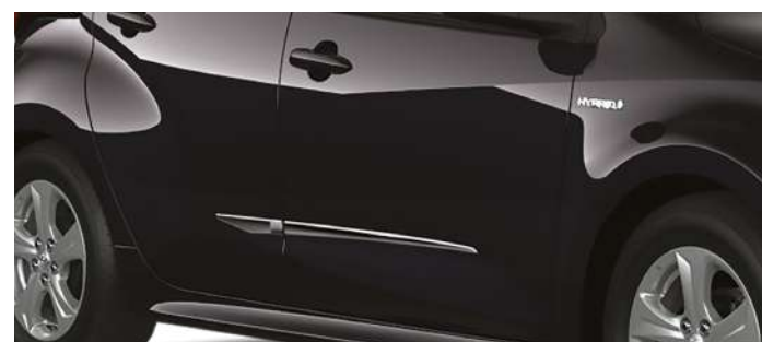
Вставки молдингів дверей, хром