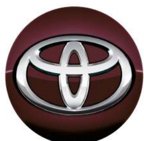
Ковпачок диска, пурпурний