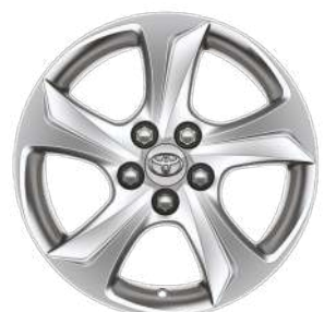
Легкосплавні диски R15