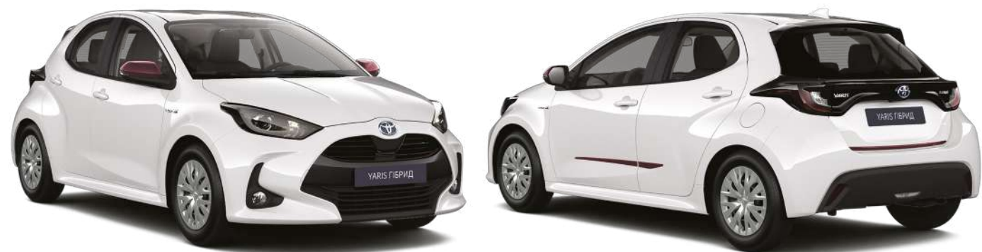
Декоративна накладка переднього бампера, пурпурна